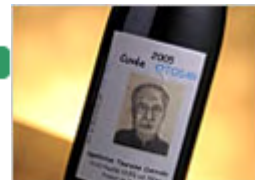
【Touraine Cuvée OTOSAN】(トゥーレーヌ・キュヴェ・オトーサン)

●「父の日限定ワイン」期間:6/15(月)～21(日) 限定2本 “Touraine Cuvée OTOSAN” トゥーレーヌ・キュヴェ・オトーサン ¥10,000